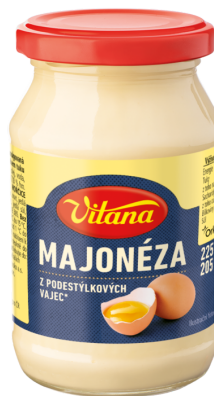
Poctivá Majonéza 225 ml