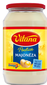
Poctivá Majonéza 225 ml